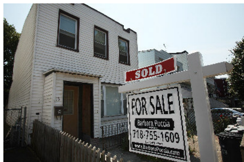
紐約市房市今年春天以來熱度不減，圖為紐約市布碌崙已售出的獨棟屋。